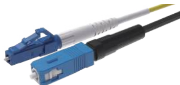
Привариваемый коннектор (FSOC)